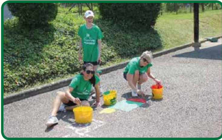
Création d'une marelle