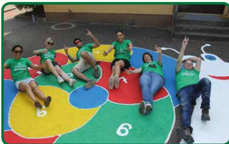
Un escargot pour la Maternelle enfin pas que....