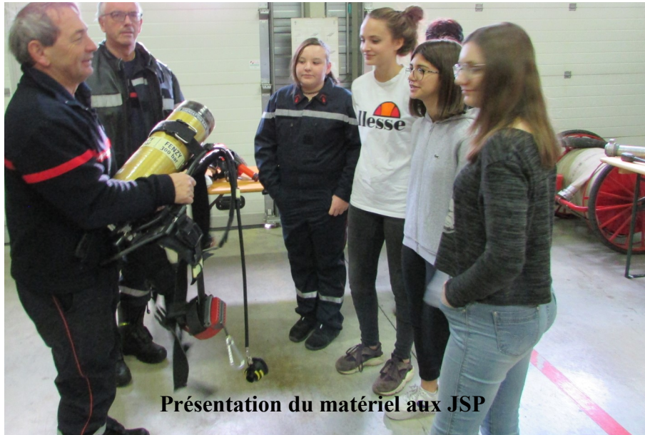
Présentation du matériel aux JSP

Outre les JSP, nous recrutons également des adultes. N'hésitez pas à venir nous voir lors de nos exercices mensuels, le 1er samedi de chaque mois de 09h00 à 12h00 ou de prendre contact avec la mairie.