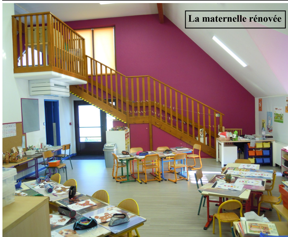
La maternelle rénovée

- Pour assurer la sécurité des personnes et des biens il est rappelé que les feux d'artifices doivent être tirés à l'écart des habitations afin de ne pas causer de dégâts.