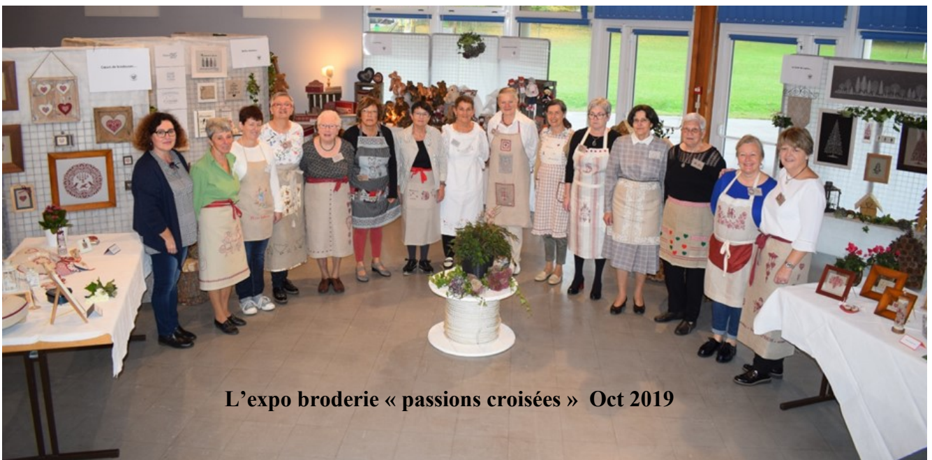
L'expo broderie « passions croisées » Oct 2019