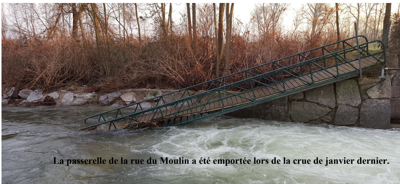
La passerelle de la rue du Moulin a été emportée lors de la crue de janvier dernier.

La passerelle de la Lauch située à l'extrémité de la rue du Moulin a été emportée lors de la crue de janvier. Elle a été récupérée, mais, après vérification, elle n'est plus aux normes. Le Conseil municipal a donc décidé de faire réaliser une nouvelle passerelle par M. Krafft Serge de Westhalten pour un montant de près de 10 000 €. Elle sera installée au courant de l'été, elle sera rehaussée et les abords seront sécurisés.