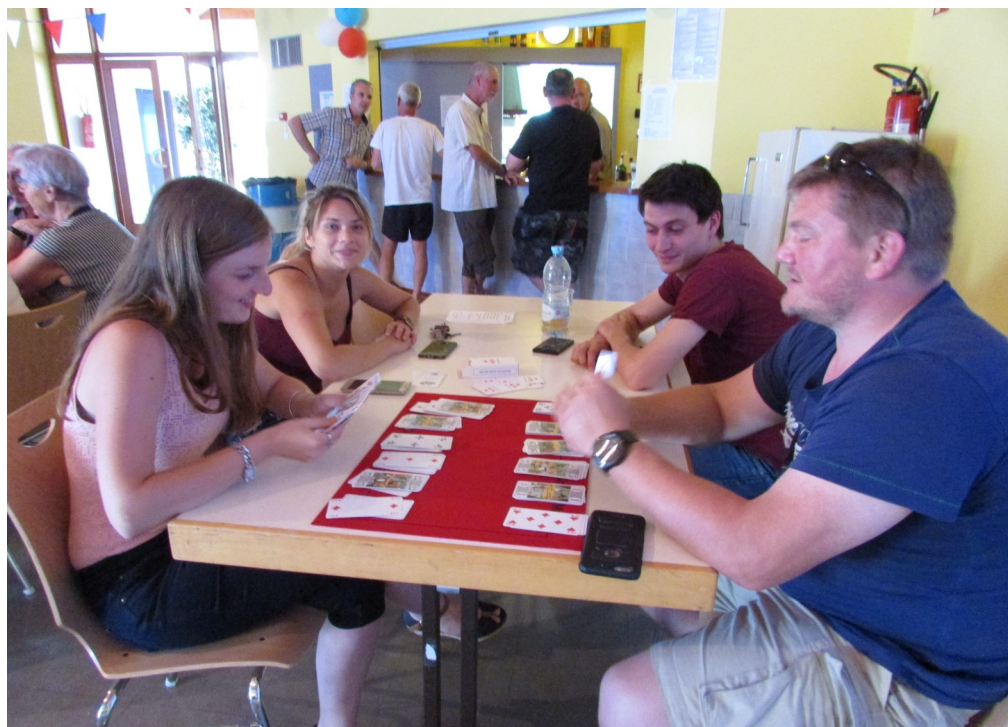
Jeux de cartes ou discussions autour d'un verre lors de l'ouverture du Gundo'Bar