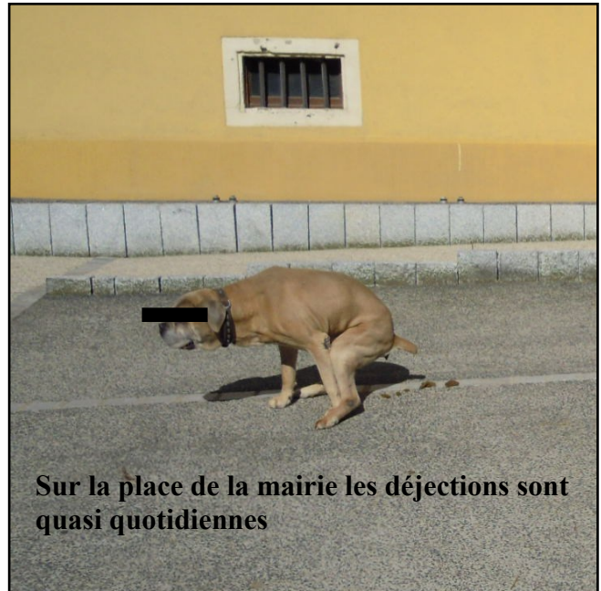
Sur la place de la mairie les déjections sont quasi quotidiennes

Afin de préserver la propreté du village, chaque citoyen possédant un chien se doit de lui apprendre la propreté et de respecter les mesures d'hygiène. Les lieux publics, notamment la place de la mairie et celle de l'église, sont quotidiennement souillés par des déjections de chiens dont les propriétaires se soucient peu de la propreté de ces lieux. Des propriétés privées non closes sont également concernées par ces souillures. L'incivisme de quelques personnes induit des accidents, des odeurs, des soucis d'hygiène ainsi qu'une dégradation évidente du cadre de vie. Un effort s'impose d'autant plus que des distributeurs de sachets canins sont disponibles près des conteneurs à verre et près de l'aire de jeux de l'école.