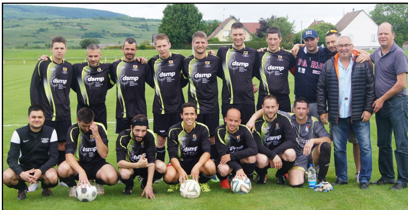
Equipe 3 – Champion D2B Groupe D – Saison 2015-2016