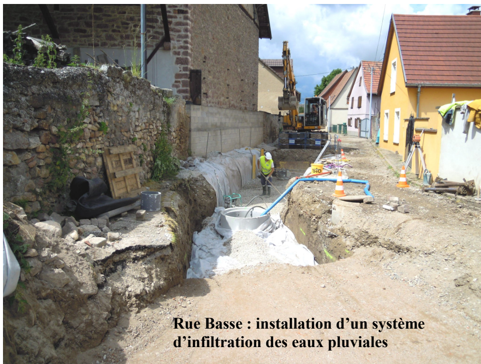
Rue Basse : installation d'un système d'infiltration des eaux pluviales

Après l'achèvement de cette deuxième phase, l'entreprise TPV reviendra sur le chantier pour poser les caniveaux et aménager la voirie.