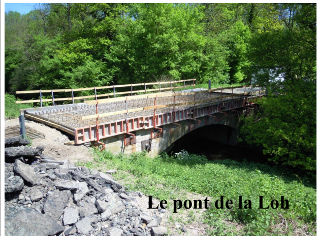
Le pont de la Loh

Le Département du Haut-Rhin a engagé d'importants travaux de réfection d'ouvrages d'art situés entre le village et la forêt. Un premier ponceau situé avant la voie de chemin de fer, a été remplacé par de nouvelles buses. Quant au pont de la Loh, situé juste avant la forêt, il a subi une cure de jouvence puisque le tablier et le parapet ont été entièrement refaits. La route est à nouveau ouverte à la circulation depuis peu.