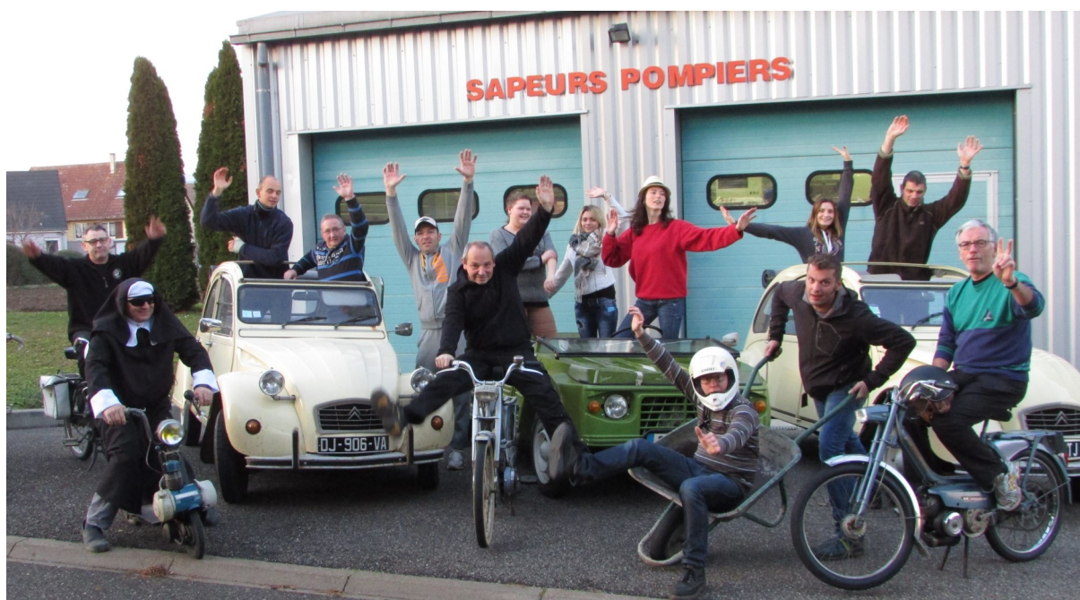
Les sapeurs pompiers préparent la GUNDO BYLETTE