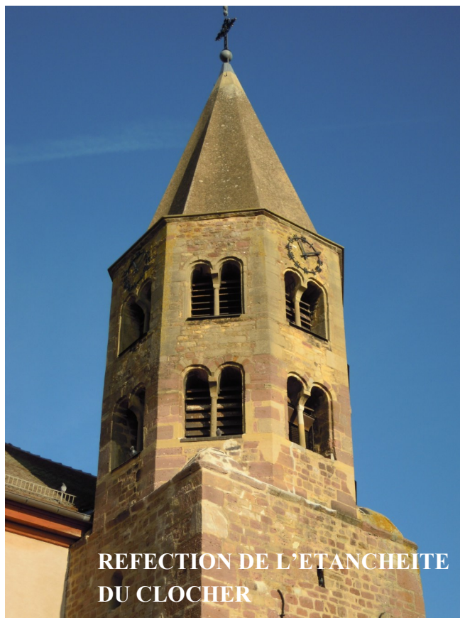
REFECTION DE L'ETANCHEITE DU CLOCHER

Le plus gros chantier a été celui de l'aménagement de l'entrée du cimetière pour un montant de 40 000 €. Un poteau d'incendie a été remplacé à l'entrée Sud du village pour 5 600 €, le remplacement des stores de la salle des fêtes a coûté 4 400 €, la réfection de l'étanchéité du clocher 10 800 €, les travaux au club house suite à une effraction et aux inondations 14 500 €, la réfection d'un trottoir 3 300 €, la modification et la révision du PLU 5 400 €, l'acquisition d'un serveur pour l'école 900 €. Un montant de 11 200 € a déjà été dépensé pour les études du chantier de la rue Basse. Par ailleurs, après le remplacement des systèmes d'alarme de l'école et de la mairie, celui de la salle des fêtes a également été remplacé.