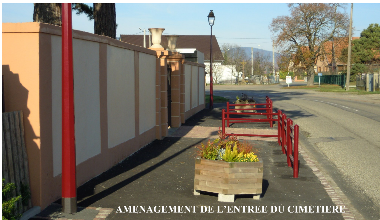
AMENAGEMENT DE L'ENTREE DU CIMETIERE